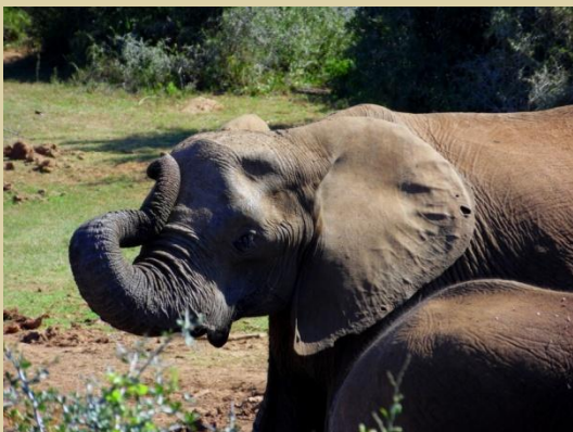
Tier des Tages: Elefant

Kurz vor Sonnenuntergang machten wir uns nach einer aufregenden Safari und einem wunderbaren Tag auf den Weg zu unserer Unterkunft Happy Lands, einer bezaubernden kleinen Farm in der Nähe des Parks, wo wir herzlich von den Besitzern empfangen wurden und einen gemütlichen Abend verbrachten.